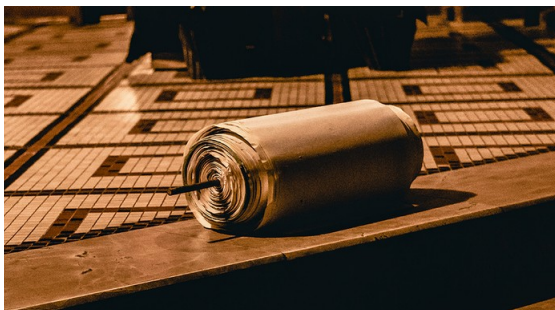
Die Namensrolle vor dem Abmarsch der Pilger noch in der Dormitio-Basilika.

auch Namen aus unserer Untereinheit, aufgrund der gemeinsamen Teilnahme an der Aktion. Außerdem wurden auch die Namen und namenlosen Stellvertreter für die Opfer des Krieges – Christen, Juden, Muslime, Menschen anderer Religionen aufgenommen. Am Stern in der Grotte der Geburtskirche wurde für alle ein Platz gefunden und so der Besuch etwas ganz Bewegendes.