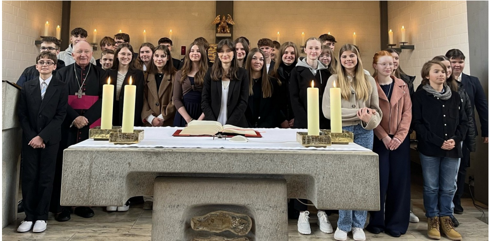
Die Neugefirmteten aus Zell, Margetshöchheim, Erlabrunn und Leinach

Verzehr beschränken dürfe, sondern das Brot Gottes sei, das uns in der Beziehung zu ihm geschenkt werde. Nicht der Konsum und der Materialismus weltlicher Güter, sondern, um an Papst Johannes Paul II. zu erinnern, der „Gott der Liebe, Gott der Gerechtigkeit und Gott der Barmherzigkeit“ ist es, der unsere Bedürfnisse stillt. Die Sehnsucht, bei Gott zu sein, stillt jeden Hunger.